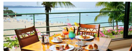
ホテルムーンビーチ