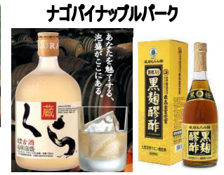
ナゴパイナップルパーク