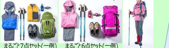
まるごと7点セット(一例) まるごと6点セット(一例)

●レンタルウェアセットを申し込まれるお客様は事前にお申し出ください。別紙レンタルウェア申込書をご記入いただきます(出発10日前最終締切)