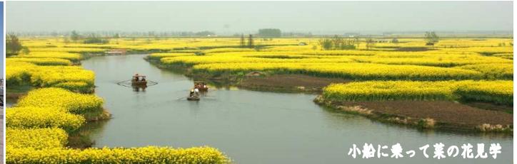
小船に乗って菜の花見学