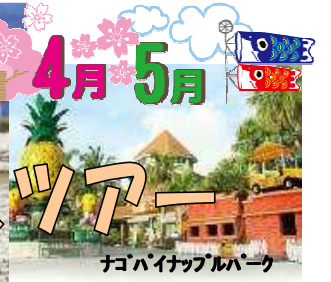
ナゴパイナップルパーク