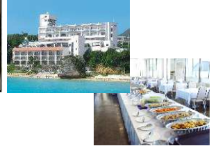
ホテルモトリゾート