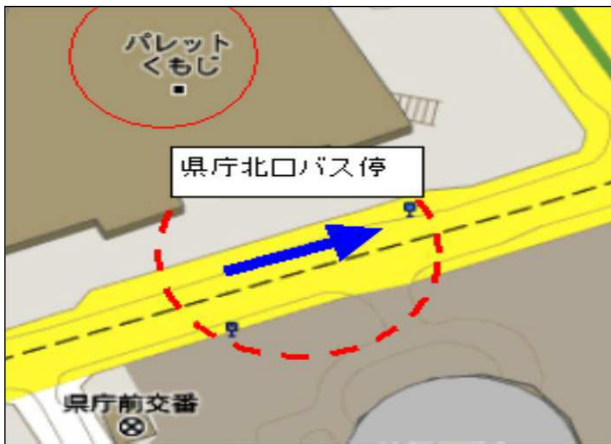
パレットくもじ前 (県庁北口バス停)