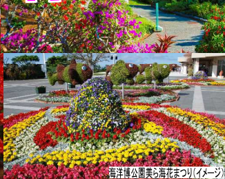
海洋博公園美ら海花まつり(イメージ)