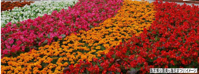
海洋博公園美ら海花まつり(イメージ)