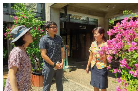
海洋博公園・熱帯ドリームセンター