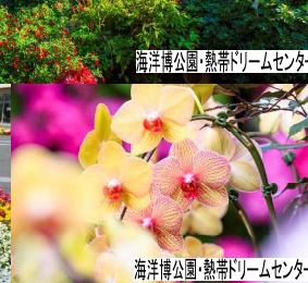
海洋博公園・熱帯ドリームセンター