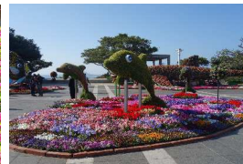
海洋博公園美ら海花まつり(イメージ)