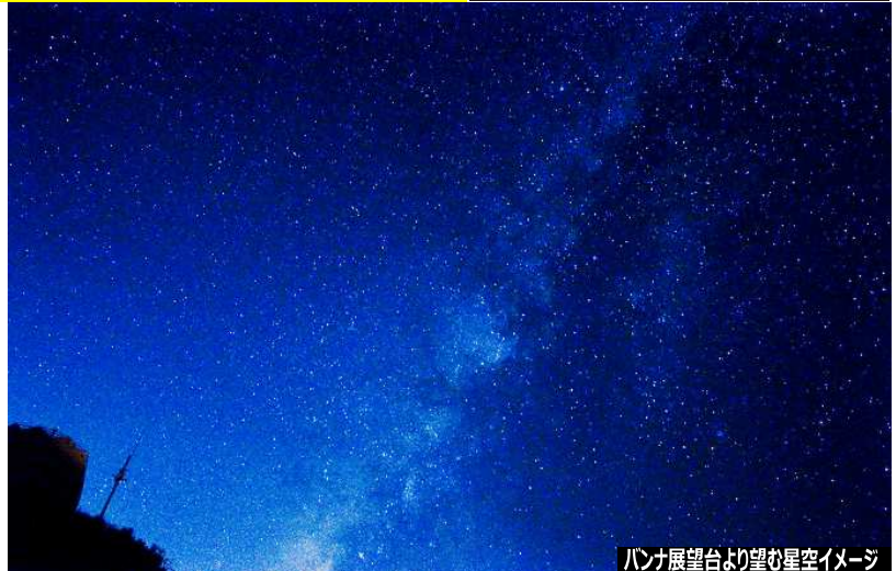
パンナ展望台より望む星空イメージ

●個人情報の取扱いについて 当社及び「受託販売」欄記載の受託旅行者(以下「当社」といいます)は、旅行申込みの際に所定の申込書に記載された個人情報について、お客様との間の連絡のために利用させていただく他、お客様がお申込みいただいた旅行において運送・宿泊機関等(主要な運送、宿泊機関等についてはホームページ、パンフレットに記載の日程表及び確定書面に記載されています。)の提供するサービスの手配及びそれらのサービスの受領のための手続きに必要な範囲内、当社の旅行契約上の責任は、事故時の費用等を担保する保険の手続き上必要な範囲内、並びに旅行先の土産品店でお客様の買い物物の便宜のために必要な範囲内で、それら運送・宿泊機関等、保険会社、土産品店等に対し、お客様の氏名、性別、年齢、住所、電話番号、搭乗便名等、あらかじめ電子的方法等で送付することによって提供いたします。お申込みいただく際には、これらの個人データの提供についてお客様に同意いただくものとします。その他、当社は、①当社及び当社と提携する企業の商品やサービス、キャンペーンのご案内、②旅行参加後のご意見や感想の提供のお願い、③アンケートのお願い、④特典サービスの提供、⑤統計資料の作成に、お客様の個人情報を利用させていただくことがあります。