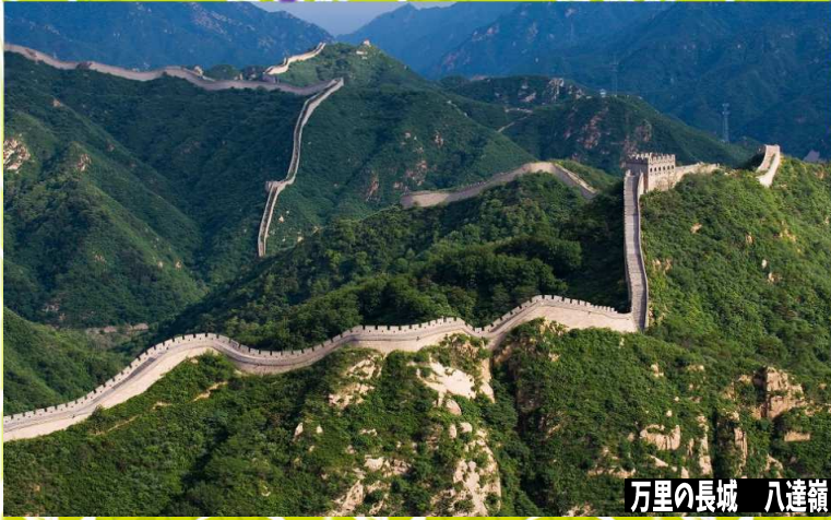
万里の長城 八達嶺