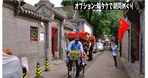
オプション: 轎子で胡同めぐり

●個人情報のご取扱いについて 当社及び「受託販売」欄記載の受託旅行者(以下「当社」といいます)は、旅行申込みの際に所定の申込書に記載された個人情報について、お客様との間の連絡のために利用させていただく他、お客様がお申込みいただいた旅行において運送・宿泊機関等(主要な運送・宿泊機関等についてはホームページ、パンフレットに記載の日程表及び確定書面に記載されています。)の提供するサービスの手配及びそれらのサービスの受領のための手続きに必要な範囲内、当社の旅行契約上の責任は、事故時の費用等を担保する保険の手続き上必要な範囲内、並びに旅行先の土産品店でお客様の買入れ物の便宜のために必要な範囲内で、それら運送・宿泊機関等、保険会社、土産品店等に対し、お客様の氏名、性別、年齢、住所、電話番号、パスポートNo.、搭乗便名等を、あらかじめ電子的方法等で送付することによって提供いたします。お申込みいただく際には、これらの個人情報データの提供についてお客様に同意いただくものとします。この他、当社は、①当社ら及び当社らと提携する企業の商品やサービス、キャンペーンのご案内、②旅行参加後のご意見やご感想の提供のお願い、③アンケートのお願い、④特典サービスの提供、⑤統計資料の作成に、お客様の個人情報を利用していただくことがあります。