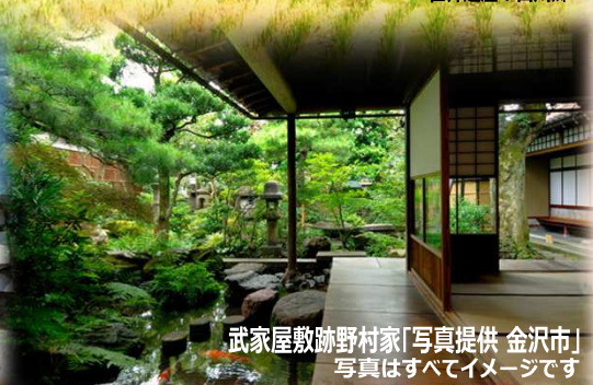
武家屋敷跡野村家 写真はすべてイメージです