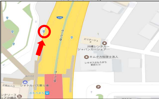
モノレールおもろまちバス停