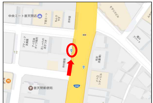
普天間市場入口バス停