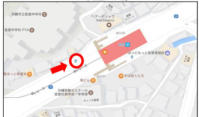
モノレール首里バス停