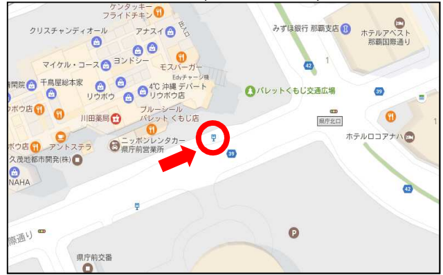
パレットくもじ前(県庁北口バス停)