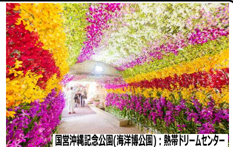
国営沖縄記念公園(海洋博公園):熱帯ドリームセンター

ホテルマハйна ウェルネスリゾートオキナワにてディナービュッフェ(本部町) 17:30頃(約80分)