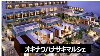
オキナワハナサホテル