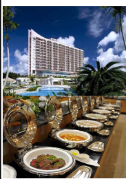
オキナワマリriott &スパ