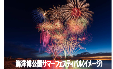
海洋公園サマーフェスティバル(イメージ)