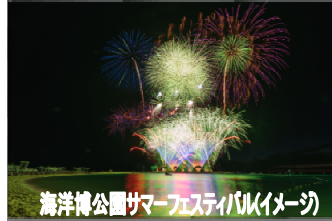
海洋公園サマーフェスティバル(イメージ)