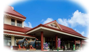
御菓子御殿名護店

※復路は渋滞が予想されますので帰着時間が 深夜になる事があります。予めご了承下さい。