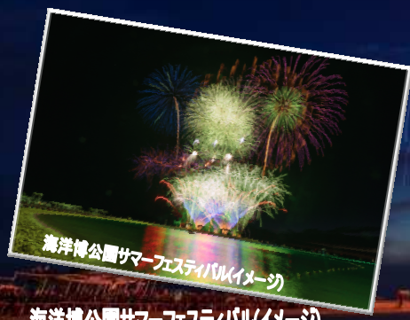
海洋博公園サマーフェスティバルイメージ