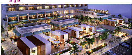
オキナワハナサキマルシェ