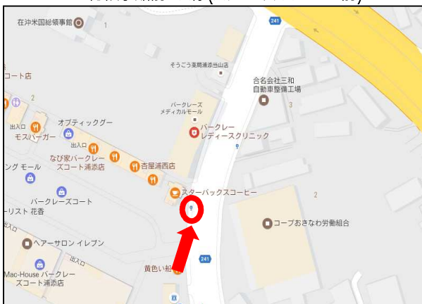
総領事館前バス停(スターバックスコーヒー前)