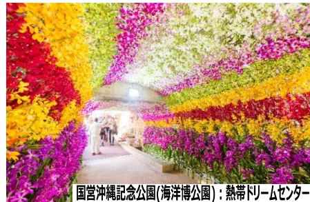
国営沖縄記念公園(海洋博公園)：熱帯ドリームセンター ディナービュッフェ イメージ

ホテルマヒナ ウェルネスリゾートオキナワにてディナービュッフェ(本部町：約80分) (トイレあり)