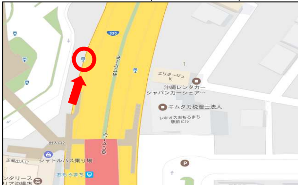
おもろまち駅バス停(DFS側/330号線沿い)