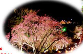
今帰仁グスクライトアップ イメージ