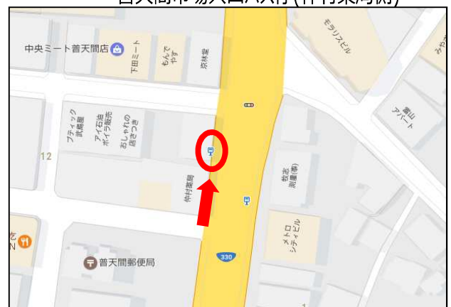
普天間市場入口バス停(仲村薬局側)