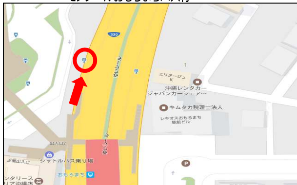
モレールおもろまちバス停