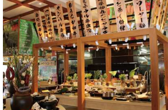
御菓子御殿名産店ランチバインイメージ