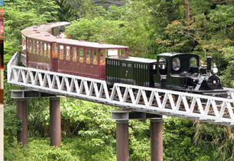
軽便鉄道イメージ