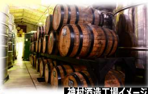
神村酒造工場イメージ

※明治15年創業。戦後の人々の心を癒す酒として愛飲されました。 工場見学後は数種類の泡盛やノンアルコールのクエン酸飲料もろみ酢の試飲タイム。