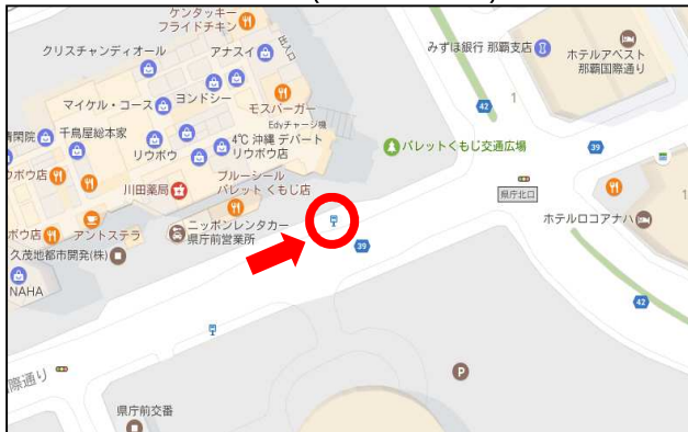
パレットくもじ前(県庁北口バス停)