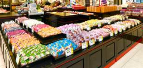
御菓子御殿名産店店内イメージ