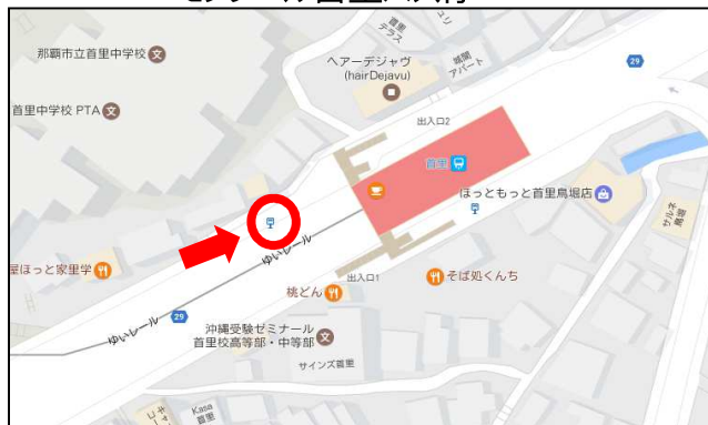
モレール首里バス停