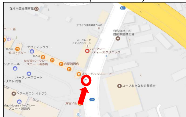
領事館前バス停(パークレズコート)