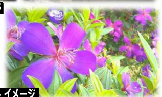
のぼたんイメージ