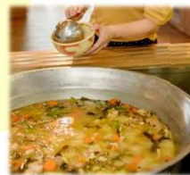
大石林山 昼食イメージ