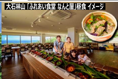
大石林山「ふれあい食堂 なんと屋」昼食 イメージ