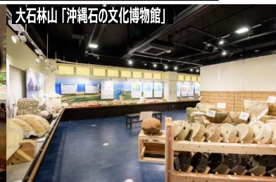
大石林山「沖縄石の文化博物館」