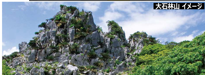
大石林山 イメージ