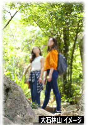
大石林山 イメージ