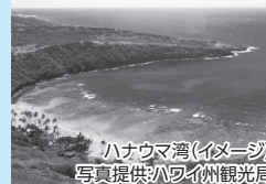
ハナウマ湾(イメージ)