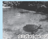
ウミガメ(イメージ)

※日本でのお申し込み (追加代金不要) は出発7日前 (土・日・祝日を除く) までになります。日本出発7日前を過ぎた場合は、現地にてお申し込みください。現地でのお申し込み (有料/各ルート紹介箇所に記載の販売価格) は参加日の前日 (午前中) までになります。各ルートの詳細は www.ana.co.jp/ja/jp/inttour/hawaii/useful/vacationgogo/ をご覧ください。