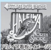
ハレイワ看板(イメージ)