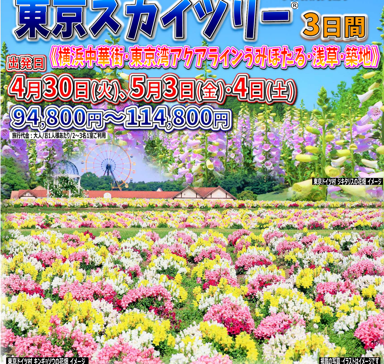
東京ドイツ村 ジキリスの花畑 イメージ