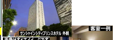
サンシャインシティプリンスホテル 外観