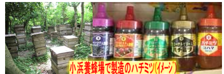
小浜養蜂場で製造のハチミツ(イメージ)

※糖度の高い完熟蜜だけを搾取したハチミツは、原液100%にこだわり、 美しい艶が特徴的で自然な甘味が人気! 試食あり♪