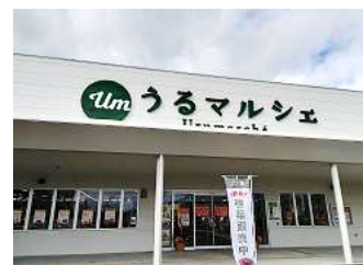
うるマルシェ(イメージ)