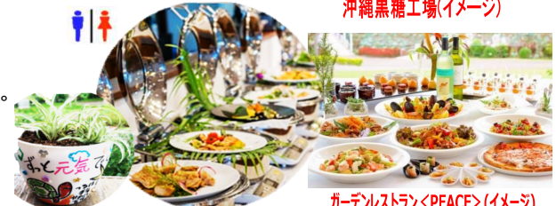
ポットプランツ(イメージ)