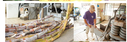
沖縄黒糖工場(イメージ)