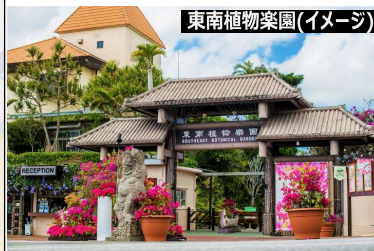
東南植物楽園(イメージ)