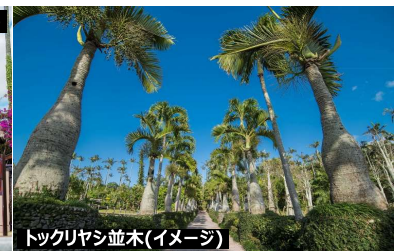
トックリヤシ並木(イメージ)