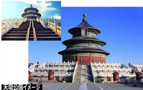
天壇公園イメージ

明・清代の歴代皇帝や聖職者たちが五穀豊穡を祈り天を祭った場所で、かつては一般人の立入りも禁じられていた神聖な場所です。天安門・紫禁城と並ぶ北京を象徴する観光スポットです。