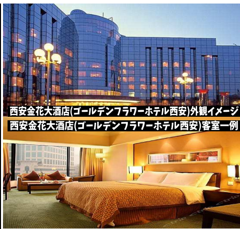
西安金花大酒店(ゴールデンフラワーホテル西安)外観イメージ 西安金花大酒店(ゴールデンフラワーホテル西安)客室一例