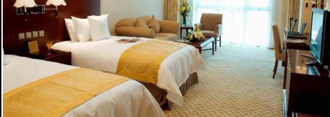
美泉宮飯店(シェールブルンホテル北京)客室一例