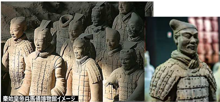
秦始皇兵馬俑博物館イメージ

「20世紀最大の発見」といわれる兵馬俑は、秦の始皇帝が死後の自分を守るために推定約8000体の等身大の兵士、馬、戦車を作らせたもので、当時の秦の軍団がそのままの形で再現されています。1・2・3号坑と銅馬車館を見学します。