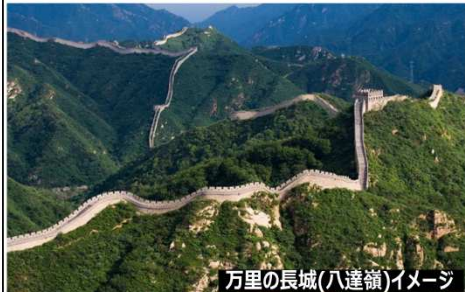
万里の長城(八達嶺)イメージ

万里の長城は紀元前7世紀の春秋時代から明代まで約二千年以上にわたり造成された世界一長い建造物。全長約3700mの八達嶺長城は万里の長城の中で最も有名で人気の観光地です。