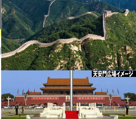
万里の長城(八達嶺)イメージ