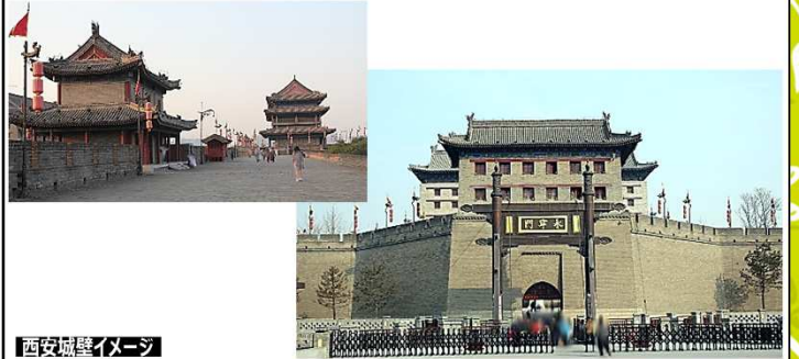
西安城壁イメージ

かつて「長安」と呼ばれた西安は十三の王朝が都をおいた中国きっての古都です。西安城壁は世界最古で最も保存状態が良い古代城壁で、長さ13.7km、高さ12m、上部の幅12mで、幅の厚みが高さと同様同じ。規模は中国一を誇ります。