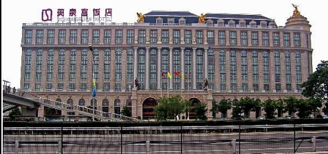
美泉宮飯店(シェールブルンホテル北京)外観イメージ 美泉宮飯店(シェールブルンホテル北京)客室一例