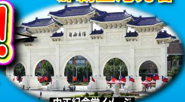
中正紀念堂イメージ