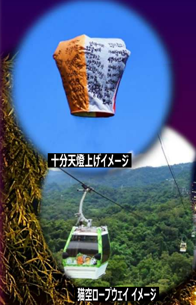
十分天燈上げイメージ

2名1室お1人様(大人・小人同額) ※諸税は変動する場合があります。あらかじめご了承ください(2019年12月現在) ※燃油サーチャージ、現地空港諸税、那覇空港施設使用料、国際観光旅客税など諸税合計約7,500円を別途事前にお支払い頂きます。