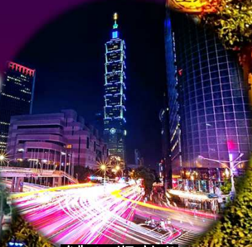
台北101エリアイメージ