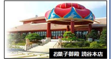
お菓子御殿 読谷本店