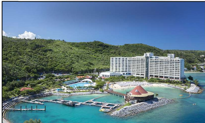
ルネッサンスリゾートオキナワ

■ 幼児(2歳)は1,500円 (いちご狩り体験代含む。バスのお座席はございません)