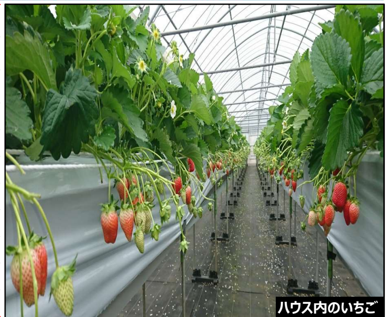
ハウス内のいちご