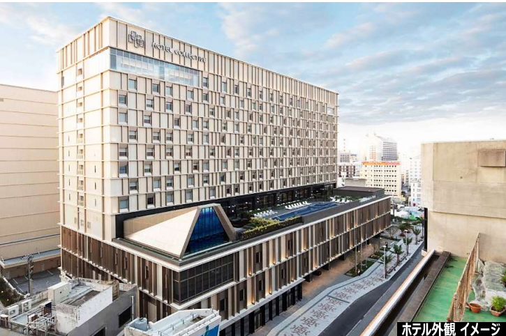
ホテル外観 イメージ