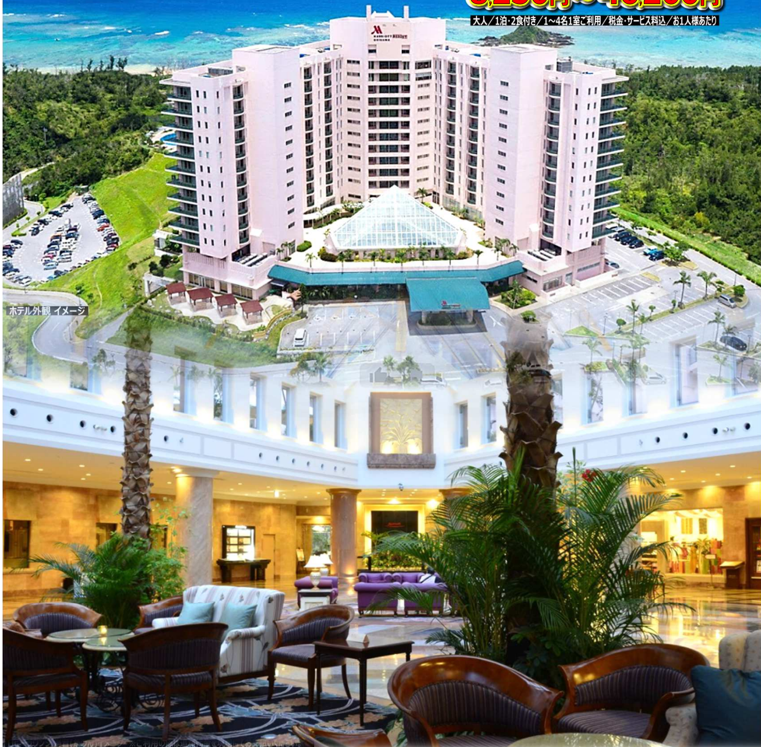
ホテル外観 イメージ