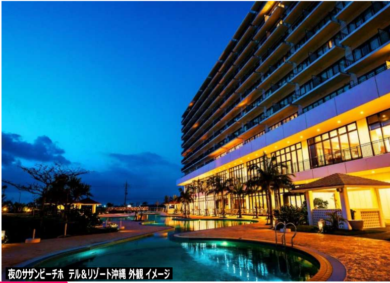
夜のサザビーホテル&リゾート沖縄 外観イメージ