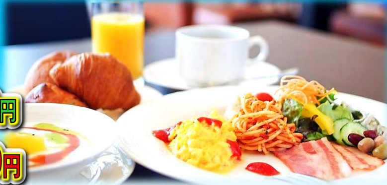
サザンビーチホテル&リゾート沖縄 朝食イメージ