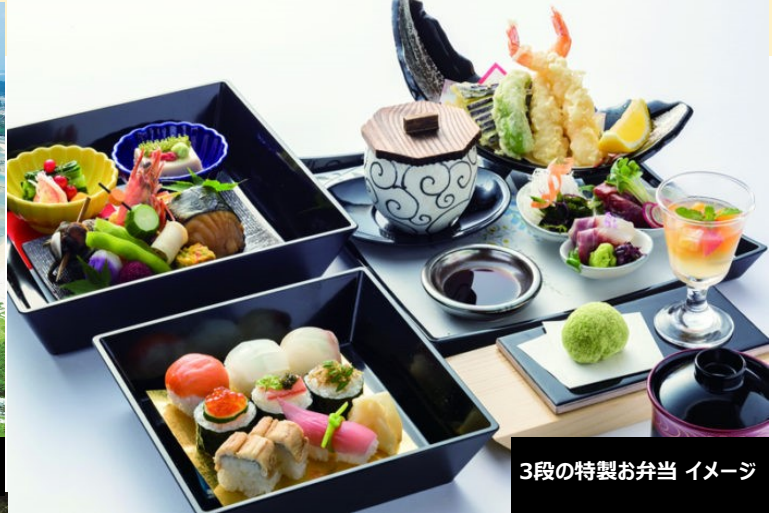
3段の特製お弁当 イメージ