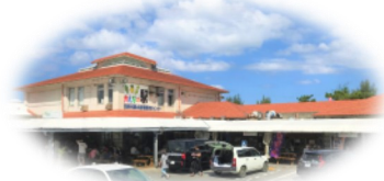
おんなの駅 なかゆくい市場 イメージ

ドライブ最中に、ちよっぴり疲れた方や休憩したい方に、ぜひオススメしたいスポットです。