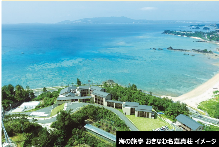
海の旅亭 おきなわ名嘉真荘 イメージ