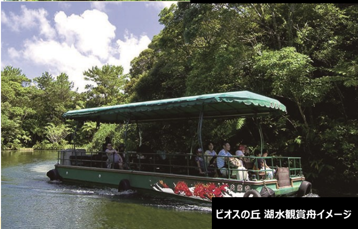
ビオスの丘 湖水観賞舟イメージ