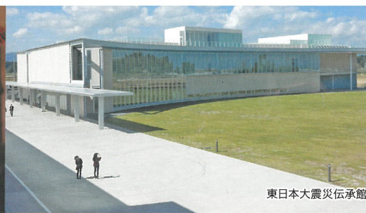
東日本大震災伝承館