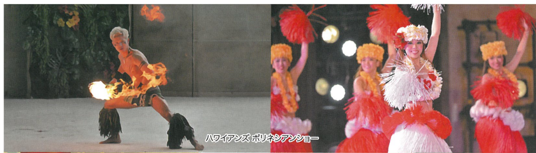
ハワイアンズ ポリネシアンショー