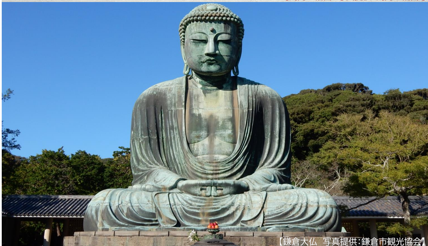
【鎌倉大仏】