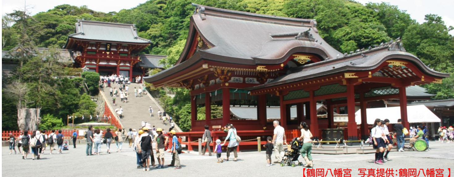
【鶴岡八幡宮】