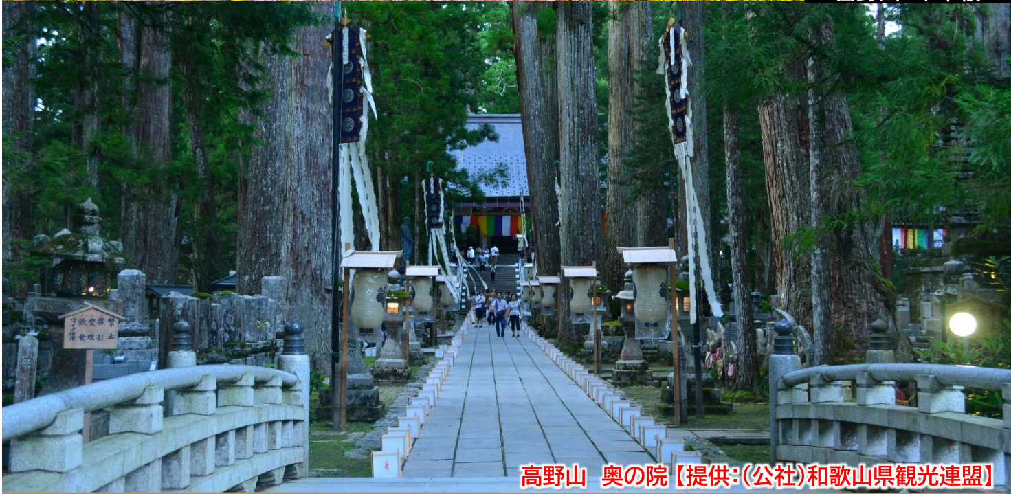
高野山 奥の院

お客様がご旅行参加中に、新型コロナウイルス感染症に罹患または濃厚接触者となった場合など、現地の法令などに基づき隔離やその他の措置が必要となった場合には、その指示に従って頂きます。またこれに要する費用はお客様のご負担となります。