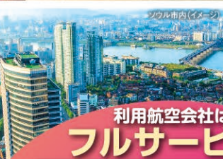
ソウル市内(イメージ)