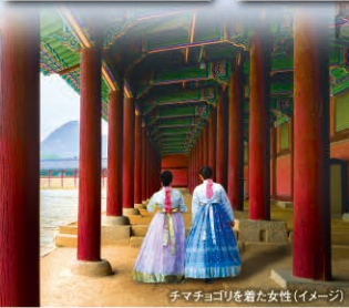
チマチョゴリを着た女性(イメージ)