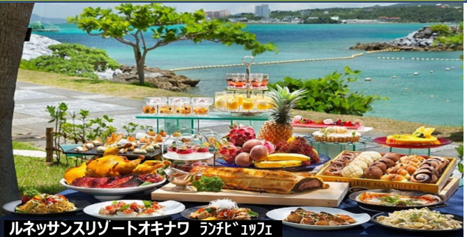
ルネッサンスリゾートオキナワ ランチ 1771