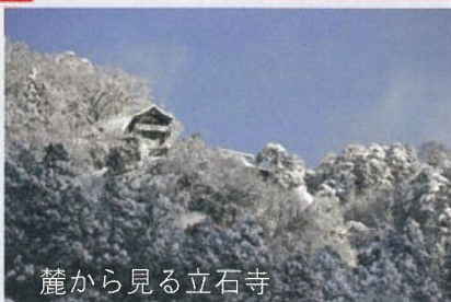
麓から見る立石寺