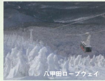
八甲田ロープウェイ