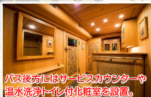
バス後方にはサービスカウンターや温水洗浄トイレ付化粧室を設置。