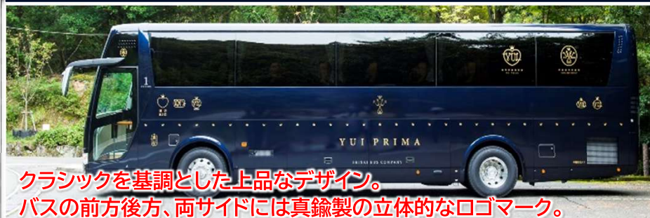
クラシックを基調とした上品なデザイン。バスの前方後方、両サイドには真鍮製の立体的なロゴマーク。

クルーズトレイン「ななつ星in九州」などを手がけた水戸岡鋭治氏がデザイン。18席からなる特別シートは体を優しく包み込み、旅行中快適に過ごせます。後部にはサービスカウンターとトイレが完備されております。