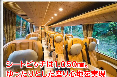
シートピッチは1,050mm。ゆったりとした座り心地を実現