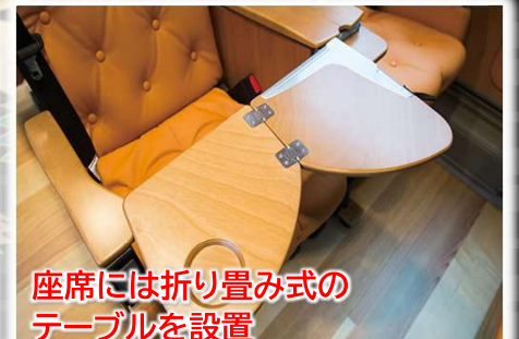
座席には折り畳み式のテーブルを設置