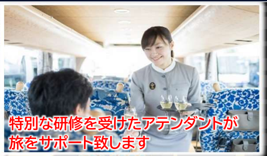
特別な研修を受けたアテンダントが旅をサポート致します