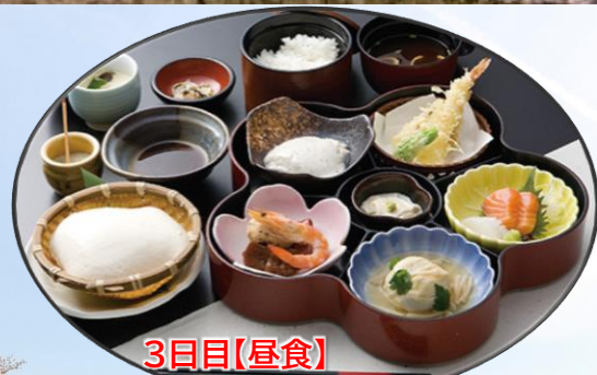
3日目【昼食】 月の蔵人「京月御前」