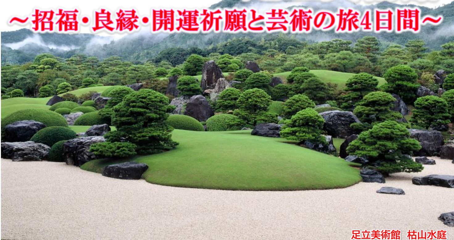
足立美術館 枯山水庭