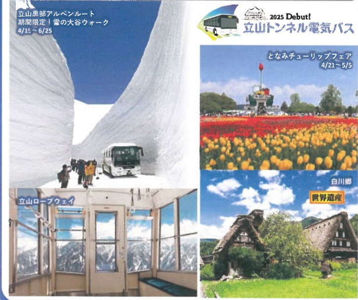
立山黒部アルペンルート 期間限定!雪の大谷ウォーク 4/15~6/25