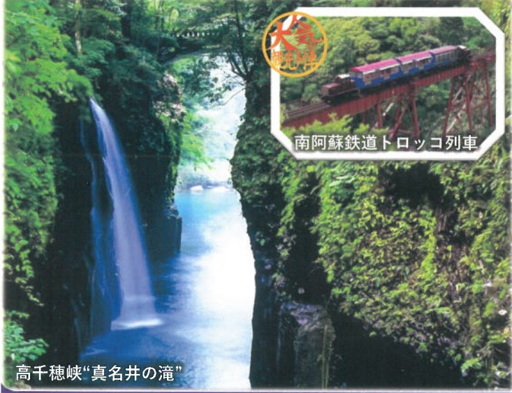
南阿蘇鉄道トロッコ列車