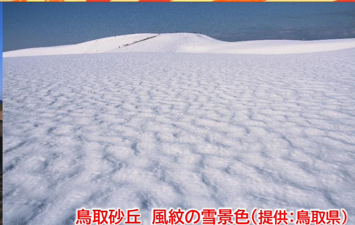
鳥取砂丘 風紋の雪景色