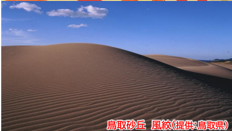
鳥取砂丘 風紋