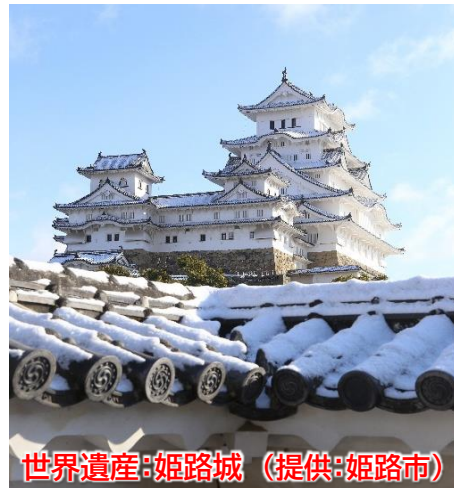
世界遺産:姫路城

※(注)【3~4名1室でお申込みの方】2泊目のホテルは2ルームに分かれます。予めご了承お願い致します。