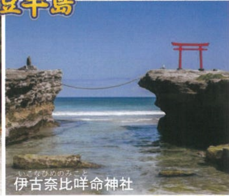
いそなむねのみこと 伊古奈比咩命神社