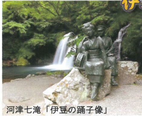
河津七滝「伊豆の躰子像」