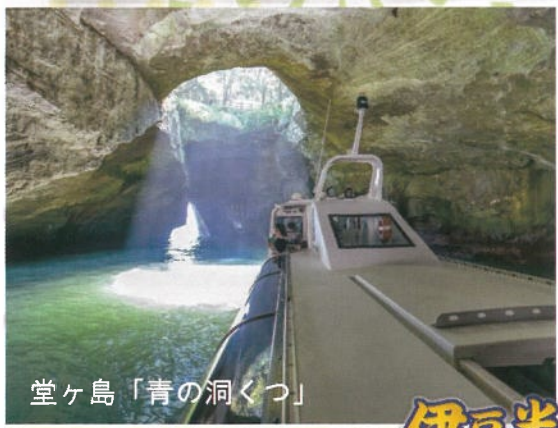
伊豆半島 堂ヶ島「青の洞くつ」

熱海海上花火大会は1952年にはじまった歴史ある花火大会です。夜空に広がり、水面に映る花火、そして、フィナーレを飾る「大空中ナイアガラ」の美しさは、瞬きを忘れるほど! 心に残る思い出ができる、熱海ならではのイベントです。