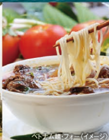
ベトナム麺・フォー(イメージ)