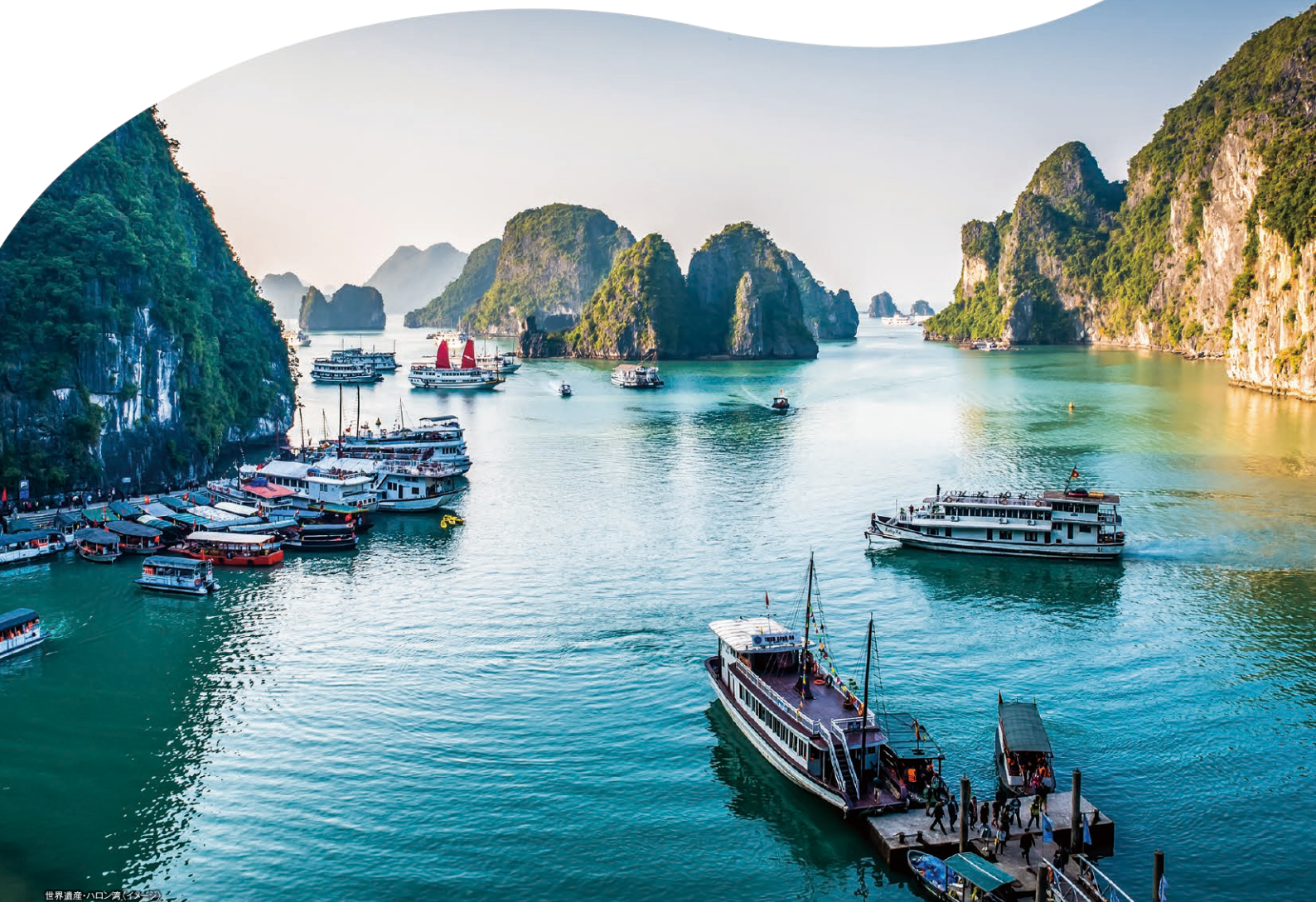
世界遺産・ハロン湾(イメージ)