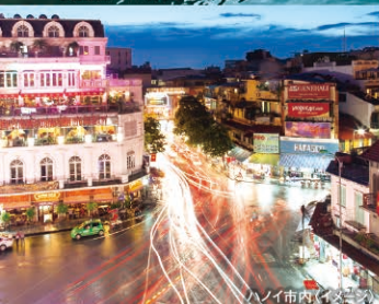
ハノイ市内(イメージ)