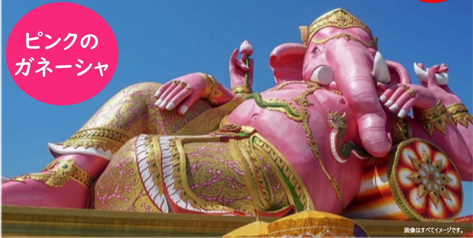
ピンクのガネーシャ