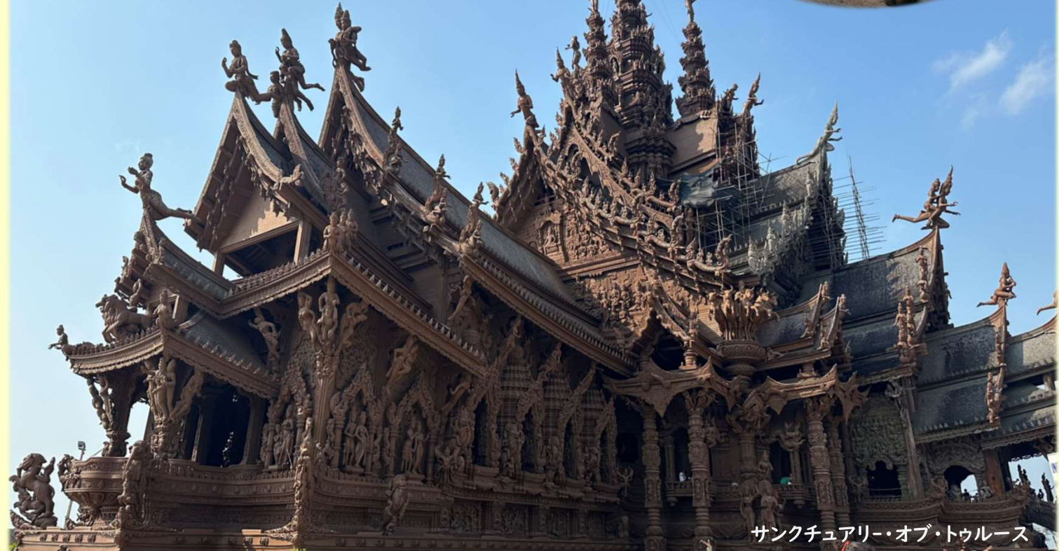
サンクチュアリー・オブ・トゥルース