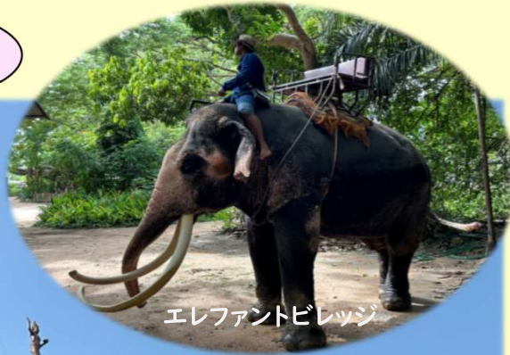
エレファントビレッジ