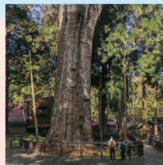
樹齢1000年の台湾ヒノキが広がる秘境を散策