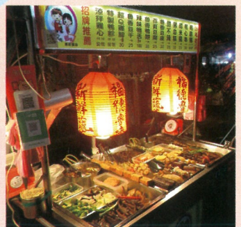
夜市ではさまざまな屋台が出ています