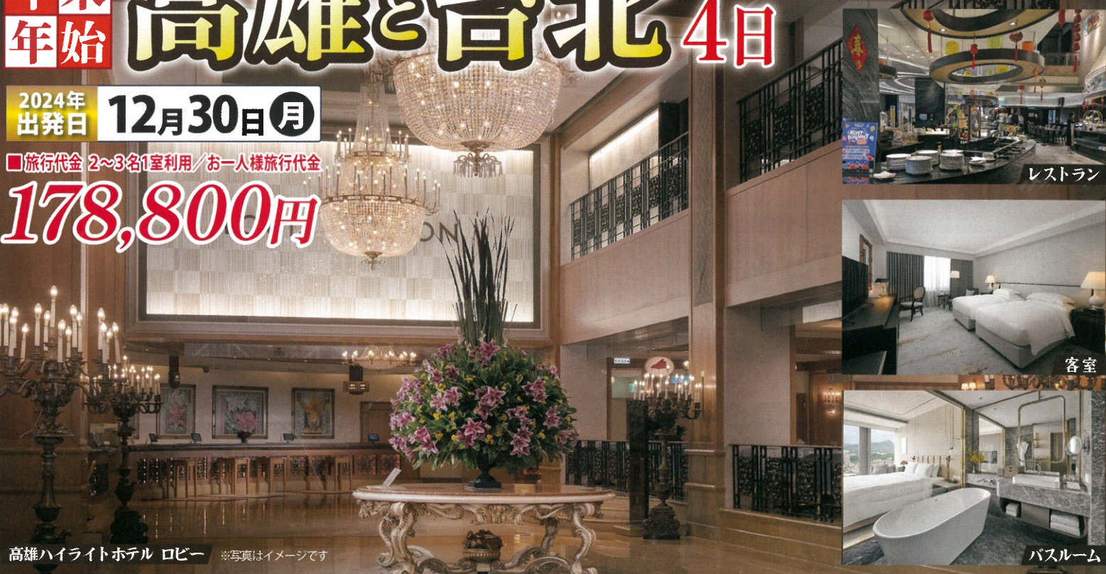
高雄ハイライトホテル ロビー ※写真はイメージです