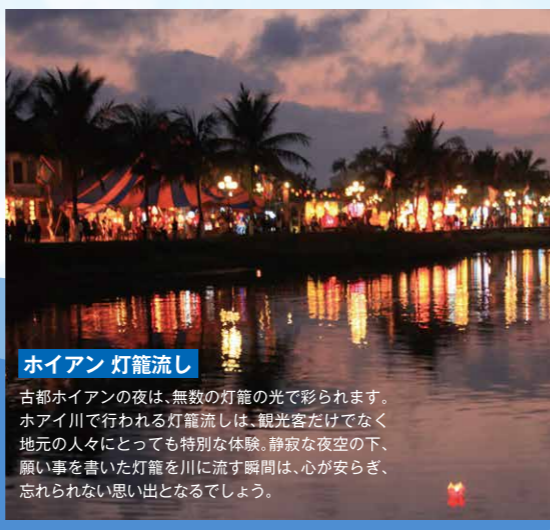
ホイアン 灯籠流し 古都ホイアンの夜は、無数の灯籠の光で彩られます。ホイアン川で行われる灯籠流しは、観光客だけでなく地元の人々にとっても特別な体験。静寂な夜空の下、願い事を書いた灯籠を川に流す瞬間は、心が安らぎ、忘れられない思い出となります。