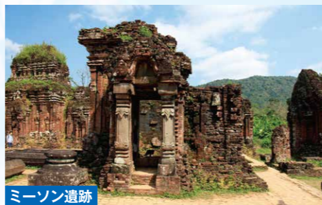
ミーソン遺跡 ベトナム中部クアンナム省にある、かつてチャンバ王国が栄華を誇った時代の聖域です。1999年にユネスコの世界文化遺産に登録され、その神秘的な遺跡は多くの観光客を魅了しています。