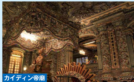
カイティン帝廟 ベトナム・フエにある阮朝第12代皇帝、カイティン帝の霊廟です。西洋と東洋の建築様式が見事に融合された独特なデザインが特徴で、ベトナムを訪れる観光客を魅了しています。