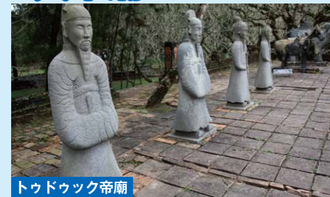
トゥドック帝廟 ベトナム・フエにある阮朝第4代皇帝、トゥドック帝の霊廟です。19世紀中頃に建設され、その美しい庭園と繊細な建築様式から、ベトナムを代表する観光スポットの一つとして知られています。