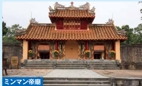
ミンマン帝廟 ベトナム・フエにある阮朝第2代皇帝、ミンマン帝の霊廟です。19世紀初頭に建設され、ベトナムの伝統的な建築様式と儒教思想が見事に融合した壮大な建造物として知られています。