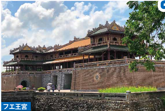
フエ王宮 ベトナム最後の王朝の栄光を今に伝える ベトナム最後の王朝である阮朝(グエン朝)の皇居として、19世紀初頭に建設されました。ベトナム中部、フエ市の中心部に位置し、1993年にはユネスコの世界文化遺産に登録されています。