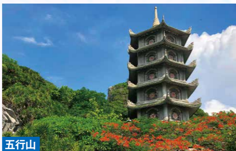
五行山 ベトナム・ダナンの南に位置する5つの石灰岩の丘からなる山々。その名の通り、五行説に基づき金・木・火・水・土の5つの山に分けられており、それぞれに洞窟や寺院が点在しています。