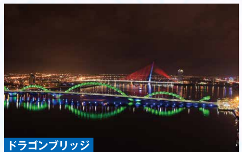
ドラゴンブリッジ ベトナム・ダナンのハン川にかかるドラゴンブリッジは、その名の通り、橋の両端に龍のオブジェが取り付けられ、夜になると火を噴いたり色が変化したりする、世界的に有名な観光スポットです。