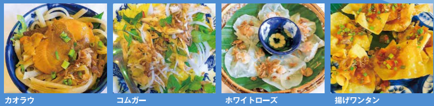
カオラウ コムガー ホワイトローズ 揚げワンタン