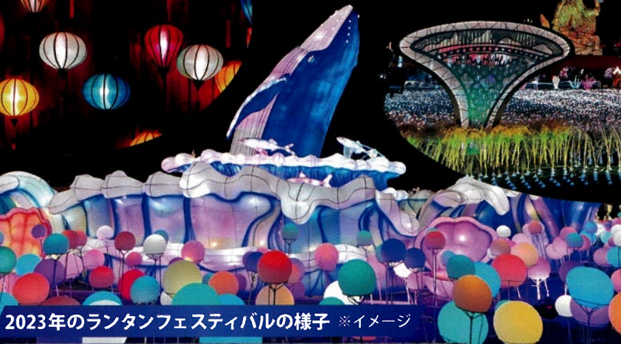
2023年のランタンフェスティバルの様子 ※イメージ