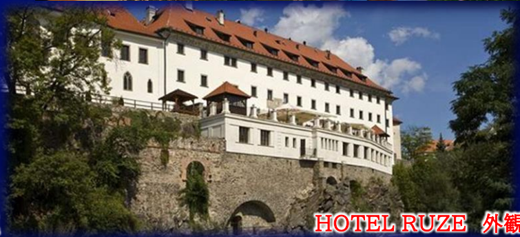
HOTEL RUZE 外観

《「HOTEL ZLATY ANDEL」に宿泊！》 《5つ星ホテル「HOTEL RUZE」に宿泊！》 ※5月15日発の宿泊 ※9月11日発の宿泊