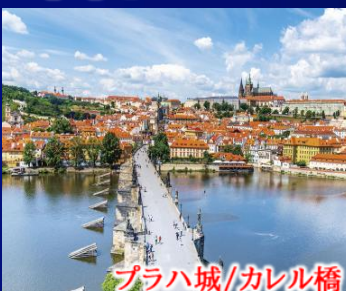
プラハ城/カレル橋

プラハ城は、「街全体が美術館」とも言われる世界最古で最大の城。 プラハ城とともに街のシンボルとなっている「カレル橋」は、1402年に完成したプラハ最古の橋です。 旧市街は「黄金の都」として栄えたプラハの中世の面影を色濃く残します。