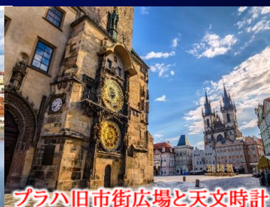
プラハ旧市街広場と天文時計