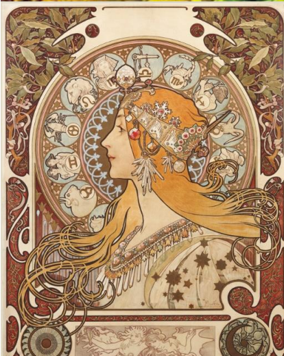
ミュシャ美術館 黄道十二宮