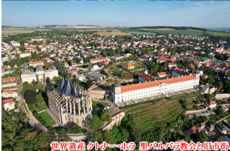
世界遺産 クトナー・ホラ 聖バルバラ教会と旧市街