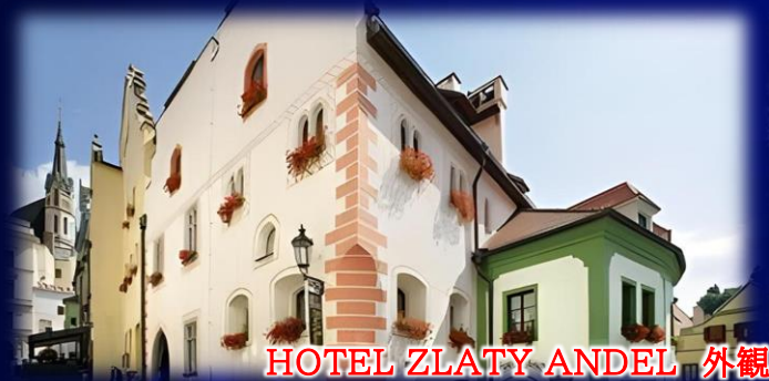
HOTEL ZLATY ANDEL 外観