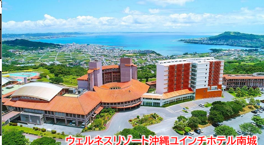
ウェルネスリゾート沖縄ユインチホテル南城