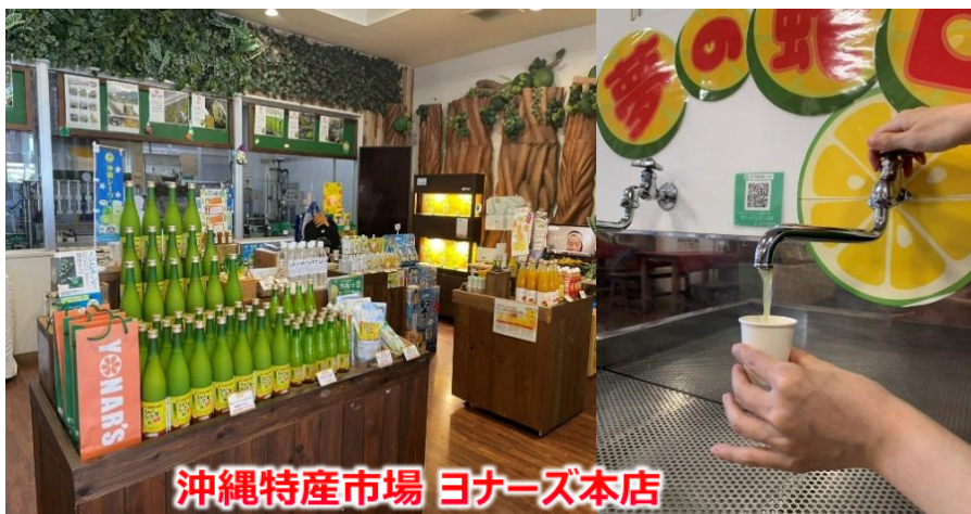
沖縄特産市場 ヨナーズ本店

* 天候、交通状況、観光地の混雑または休業等により行程が多少変更になる場合もございます。