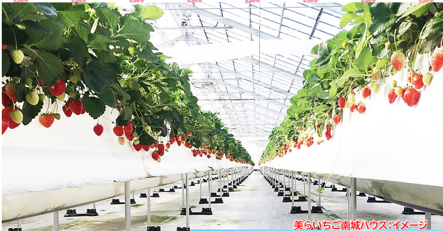
美らいちご南城ハウス：イメージ