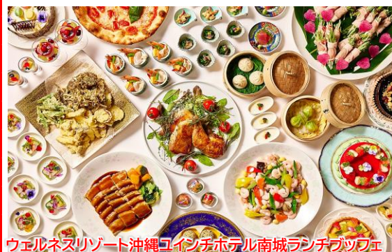
ウェルネスリゾート沖縄ユインチホテル南城ランチbuffet