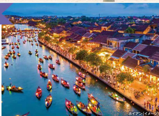
ホイアン(イメージ)