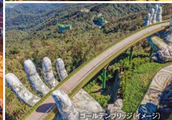
ゴールデンブリッジ(イメージ)