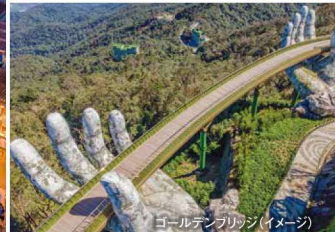
ゴールデンブリッジ(イメージ)