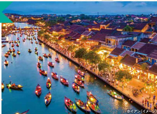
ホイアン(イメージ)