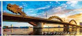
ドラゴンブリッジ(イメージ)