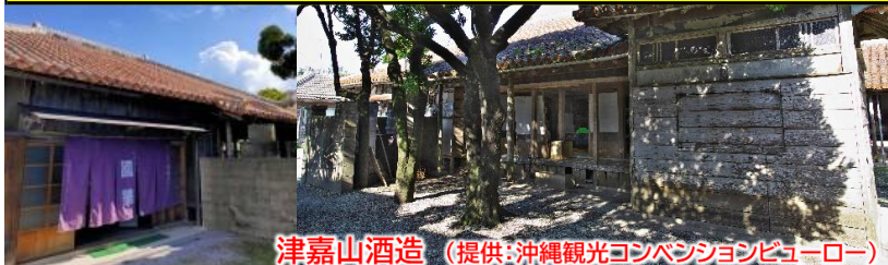
津嘉山酒造

*天候、交通状況、観光地の混雑または休業等により行程が多少変更になる場合もございます。予めご了承ください。