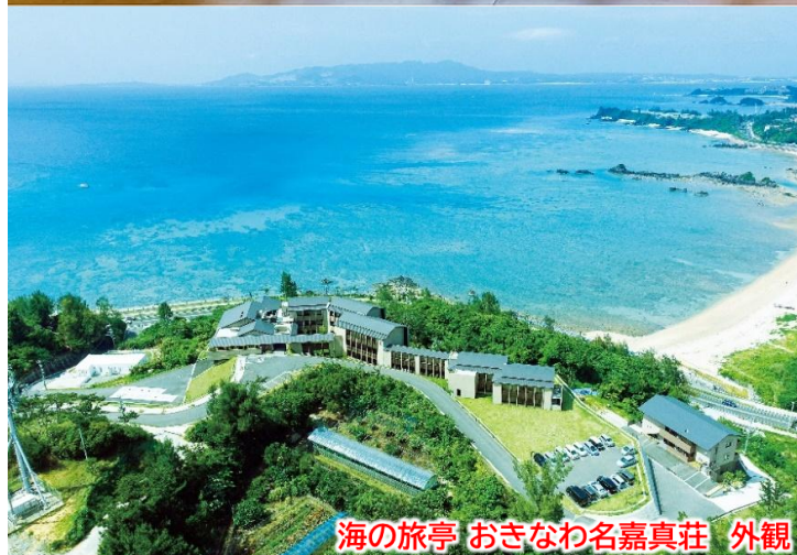
海の旅亭 おきなわ名嘉真荘 外観