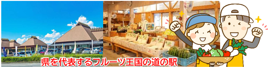
県を代表するフルーツ王国の道の駅

*天候、交通状況、航空便スケジュールの変更、観光地の混雑又は休業等により行程が多少変更になる場合もございます。