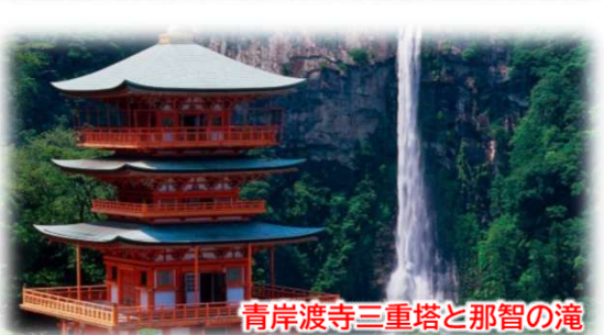
青岸渡寺三重塔と那智の滝