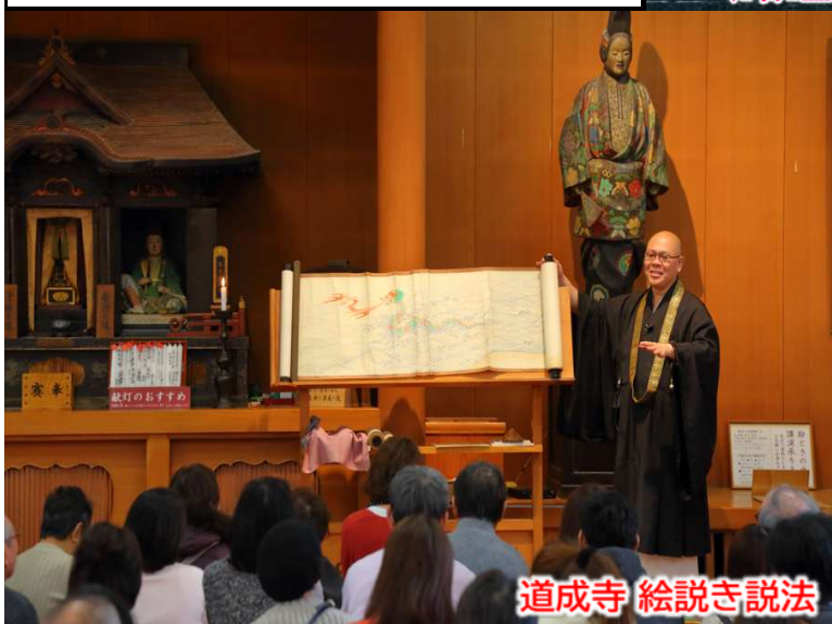
道成寺 絵説き説法

97,800円～126,800円 (4名1室利用お一人様あたり) (1名1室利用お一人様あたり)